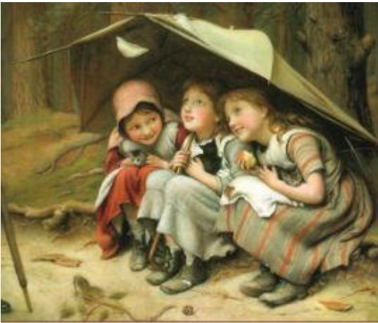
Джазэф Кларк. Три котёнка. 1883. Национальный музей искусств, г. Цинциннати, США