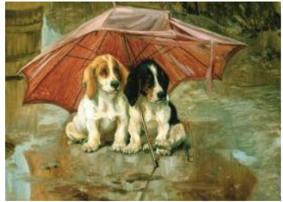
Вильям Генри Хамильтон. Щенята. 1888. Королевская академия искусств, Лондон, Великобритания