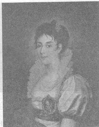
Н.И. Аргунов. Портрет П.И. Жемчуговой-Ковалёвой

Для своей труппы граф построил оригинальный дворец-театр в Останкино. Во дворце на спектаклях бывал весь высший свет. На сцене одновременно могли играть 200 человек. С помощью специальных механизмов быстро менялись декорации, написанные талантливыми художниками. В театре шли оперы и балеты русских и иностранных композиторов. После спектаклей начинались танцы. Зрительный зал и сцена театра могли быстро превращаться в танцевальный зал.