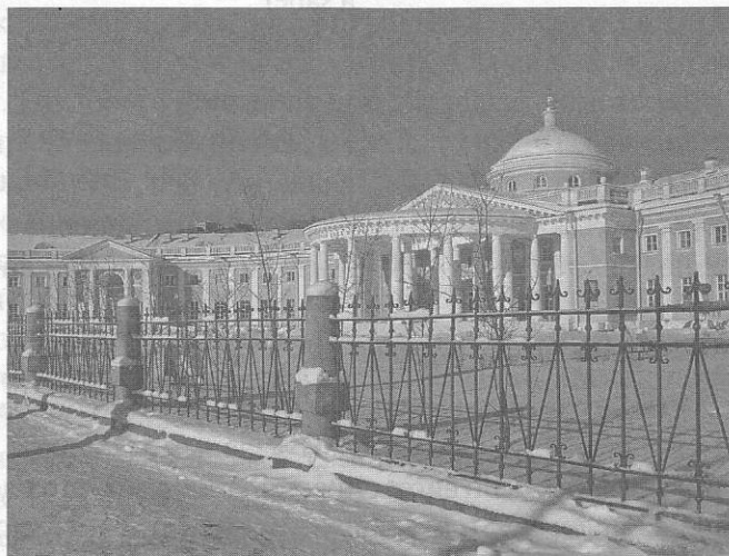
Москва. Институт скорой помощи им. Склифосовского